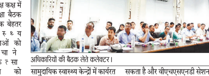
अधिकारियों की बैठक लेते कलेक्टर।

सामुदायिक स्वास्थ्य केंद्रों में कार्यरत चिकित्सकों के द्वारा किए गए ओपीडी कार्य की जानकारी ली एवं सभी चिकित्सकों को समय में उपस्थित रहकर ओपीडी कार्य सुनिश्चित करने निर्देश दिए। कलेक्टर ने विलेज हेल्थ सैनिटाइजेशन एंड न्यूट्रिशन डे के कार्य योजना की जानकारी लिया एवं जहां दुर्गस्थ क्षेत्र है जिसका स्थान चयन किया जा