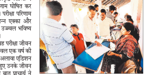
परीक्षा परिणाम लेने पहुंचे अभिभावक व छात्र-छात्राएं।