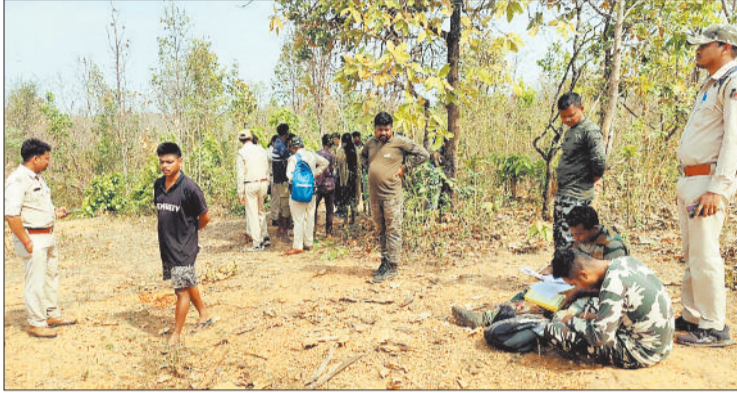
मौके पर वन विभाग की टीम।