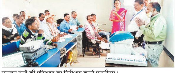
मतदान दलों की प्रशिक्षण का निरीक्षण करते एसडीएम।

जशपुरनगर। विधानसभा क्षेत्र अंतर्गत आगामी लोक सभा चुनाव 2024 हेतु मतदान दलों का प्रथम प्रशिक्षण सोमवार को स्वामी